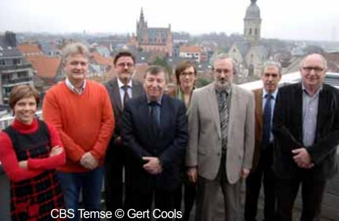
CBS Temse © Gert Cools