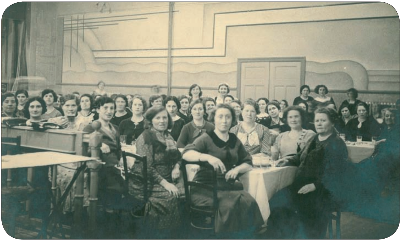
Feest van de Liberale Vrouwen, Temse, jaren '30.