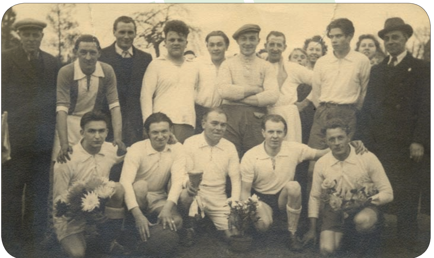
Gelegenheidsvoetbalploeg van pronostiekclub Blauw-Zwart uit Elversele, vermoedelijk 1948.