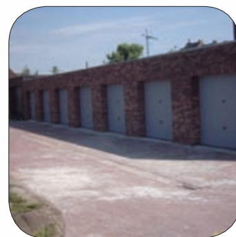
Aan de Wegvoeringstraat te Sint-Niklaas zijn nog een aantal garages te koop

In drie grotendeels afgewerkte woonprojecten van het I.C.W. worden komend jaar als laatste stap in de realisatie garages gebouwd. Het betreft de projecten Marcel Van der Aastraat (Beveren-centrum), Weverstraat (Kieldrecht) en Klokkedreef (Sint-Niklaas). In de twee eerstgenoemde projecten krijgen gelijktijdig een aantal aanpalenden de mogelijkheid om voor hun woning een uitweg naar achter toe te nemen. In Klokkedreef wordt volgend voorjaar de nu nog voorlopige bestrating definitief afgewerkt.