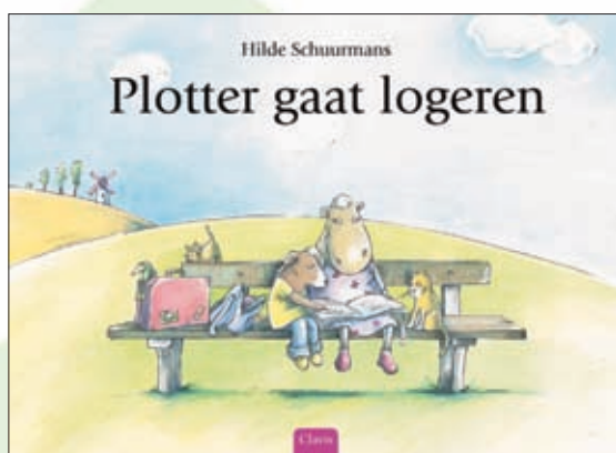
© 2008, Clavis Uitgeverij Hasselt-Amsterdam, Plotter gaat logeren, illustratie van Hilde Schuurmans

Ga dus vanaf één februari 2008 zeker langs bij de "Plotter-gaat-logeren-stand" in de bib! Mooi meegenomen!