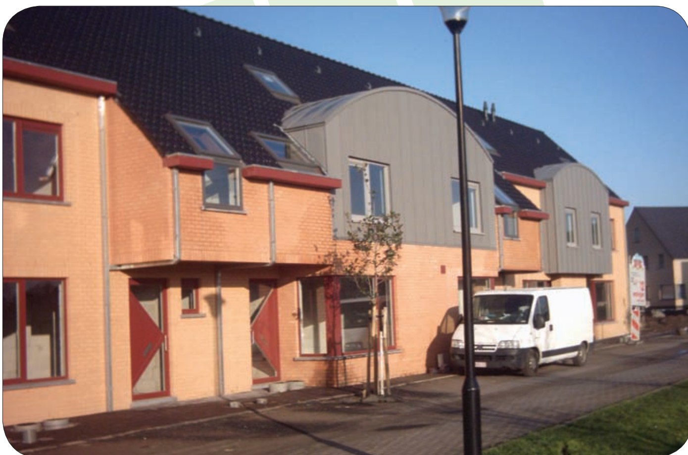
Kieldrecht – woonproject Weverstraat: vooraanzicht van de woningen